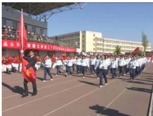
学院运动员代表队