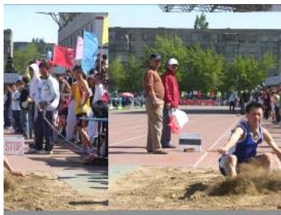
跳远落下的瞬间 (文亮)