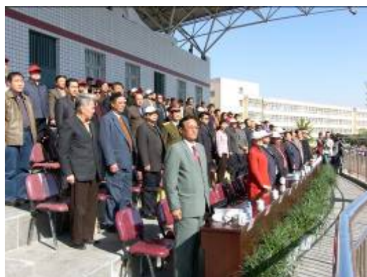
在国歌声中开幕式上的各位领导嘉宾