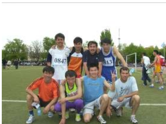
立下赫赫战功的男子接力队