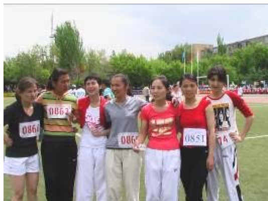
女子接力者的笑容