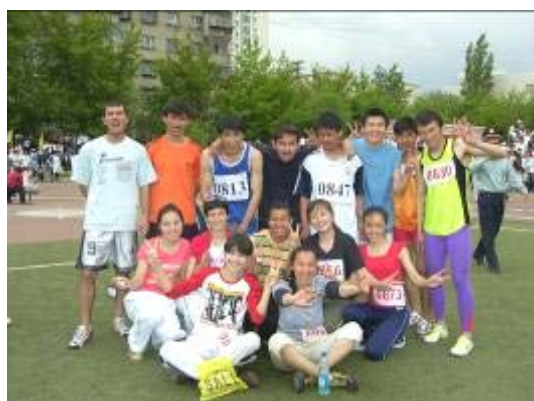
男女接力队员胜利后的喜悦