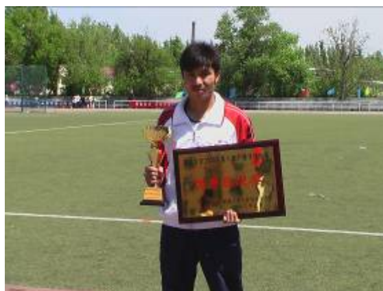
与法学院特招生争雄