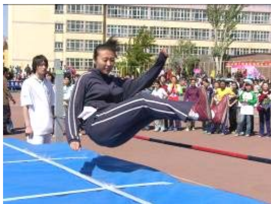
象飞燕一样的跳高