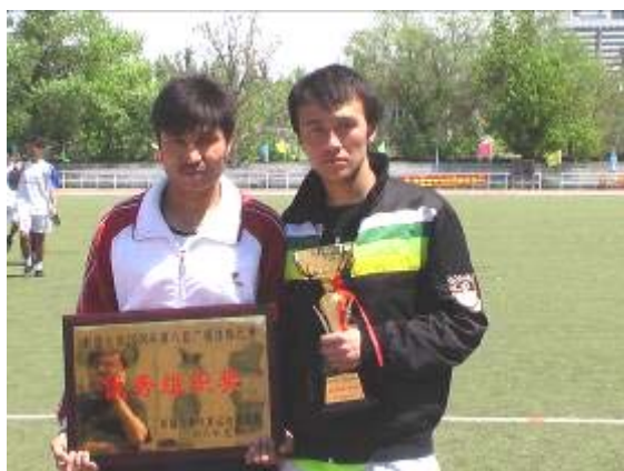
明星激情后的沉默