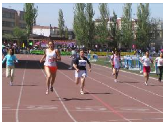
胜利者的笑容 (胡西塔尔)