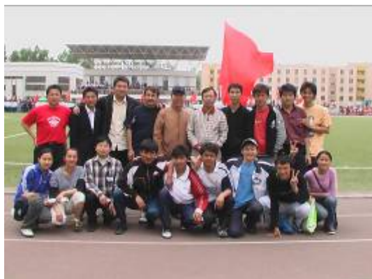
学院领导和学生精英的合影